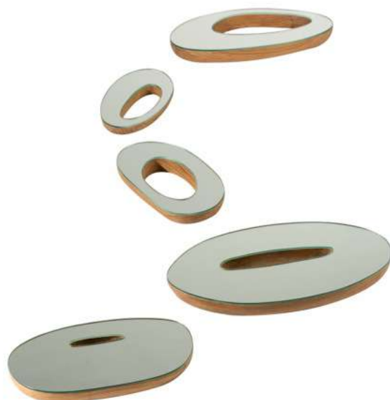
Sin Sin Man day2day Mirror, Teakwood approx. 300 x 250 cm 2020