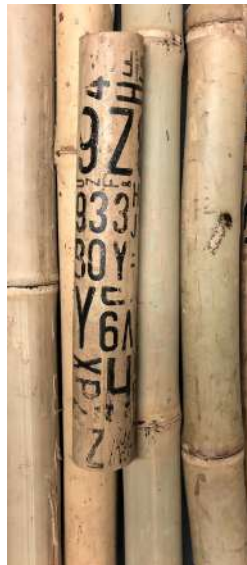
Wong Tong Numbers Sound Installation 2020