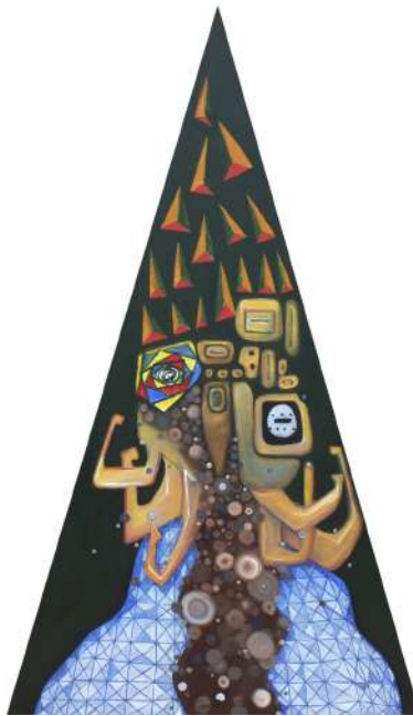
Wong Tong The Power 151 x 84 cm Oil on Canvas 2015